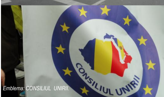
Emblema: CONSILIUL UNIRII.