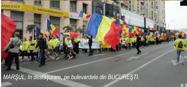
MARȘUL, în desfășurare, pe bulevardele din BUCUREȘTI.