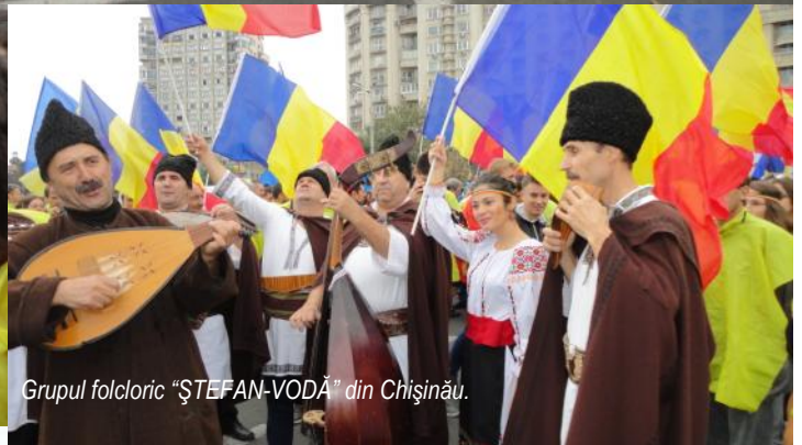
Grupul folcloric "ȘTEFAN-VODĂ" din Chișinău.