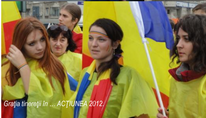
Grația tinereții în ... ACȚIUNEA 2012.