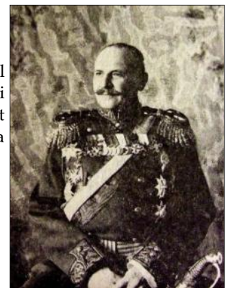
General-locotenentul Aleksandr Aleksandrovici Mosolov, cel care a semnat Procesele verbale de preluare a Tezaurului României