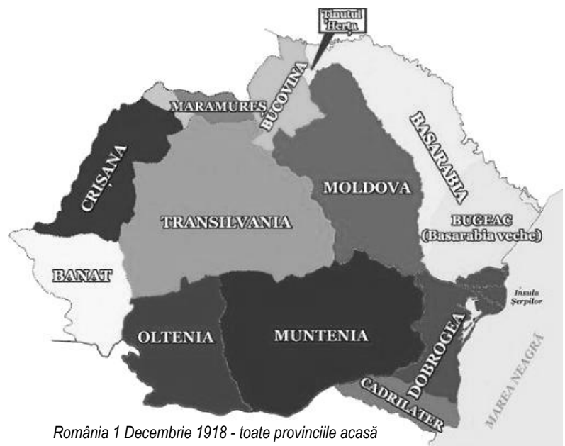
România 1 Decembrie 1918 - toate provinciile acasă