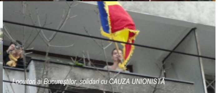
Locuitori ai Bucureștilor, solidari cu CAUZA UNIONISTĂ