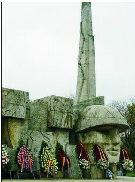
CAREI - Monumentul Eroilor Români din Al Doilea Război Mondial

Era, acesta, ultimul act ce desăvârșea, printr-o politică injustă și dictatorială, destrămarea României Mari. Din acel moment, principalul obiectiv al conducerii statale,