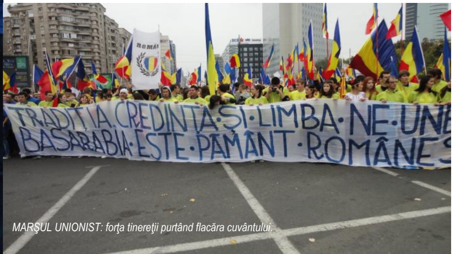
MARȘUL UNIONIST: forța tinereții purtând flacăra cuvântului.