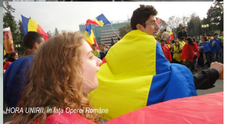
HORA UNIRII, în fața Operei Române