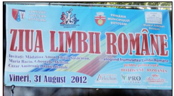
Afișul oficial al manifestării „Ziua Limbii Române – Botoșani, 31 august, 2012”