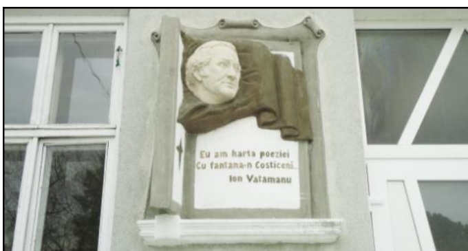
Basoreliev cu efigia poetului Ion Vatamanu, la școala care-i poartă numele, din Costiceni.