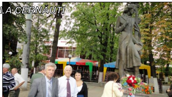
Depuneri de jerbe de flori la statuia poetului Mihai Eminescu, Cernăuți;