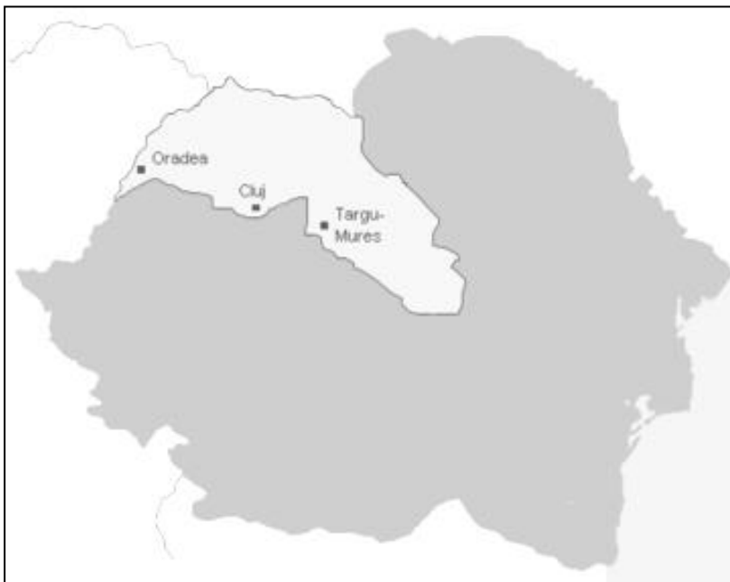
Harta României interbelice: în culoare deschisă este marcată porțiunea cedată Ungariei în urma Dictatului de la Viena

Negocierile prin intermediul reprezentanților Germaniei și Italiei au început la 16 august 1940 la Turnu Severin. Ungaria a pretins circa 69.000 km 2 din suprafața României, la care guvernul român a răspuns oferind un schimb de populație și o serie de rectificări minore ale granițelor. În final, negocierile de la Turnu Severin au eșuat și se părea că disputa româno-ungară