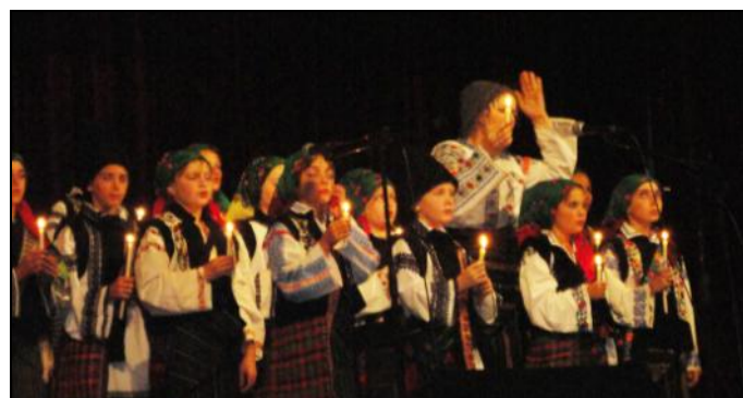
Făclii în mâini – făclii în suflete.