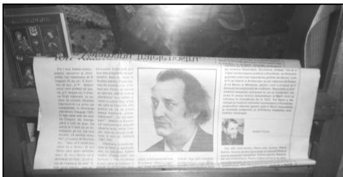
Poetul Ion Vatanu, în presa vremii;