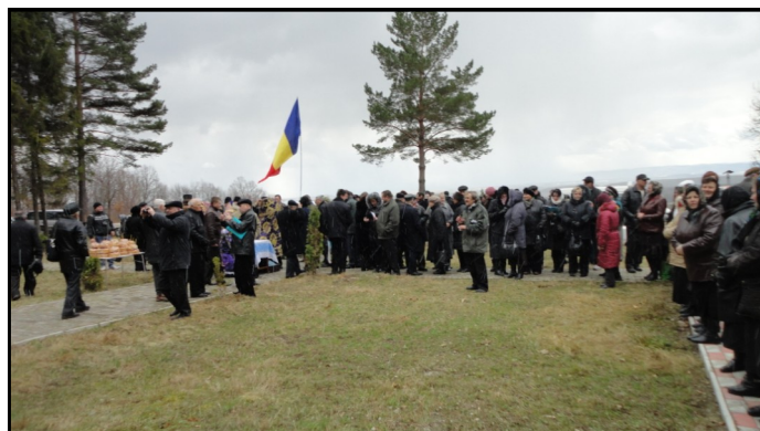
Fântâna Albă, Bucovina de Nord, 1 aprilie 2012.