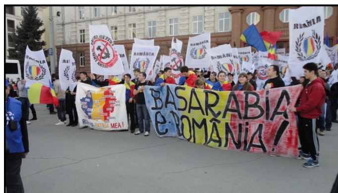
Chișinău, 25 martie 2012.