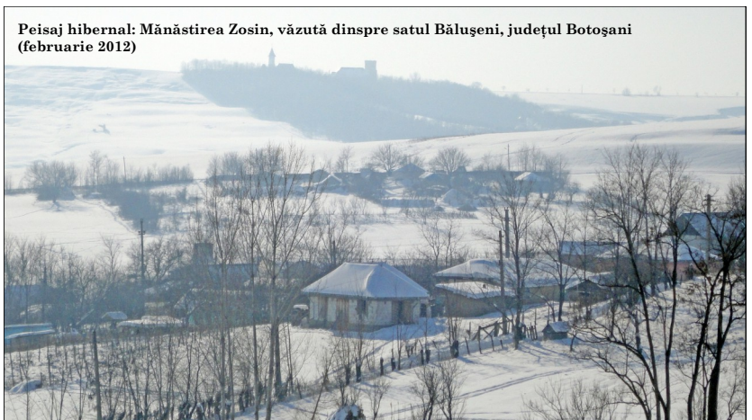
Peisaj hibernal: Mănăstirea Zosin, văzută dinspre satul Bălușeni, județul Botoșani (februarie 2012)