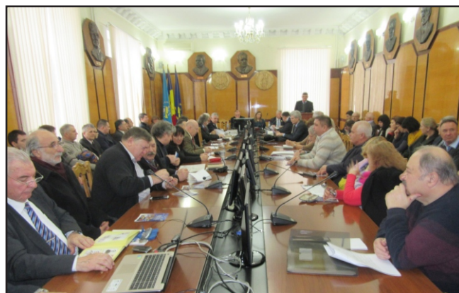
Chișinău, 24.01.2018, Academia de Științe a Moldovei: imagine din sală din timpul desfășurării lucrărilor Conferinței științifice: „Unirea Principatelor române și problema Basarabiei”.