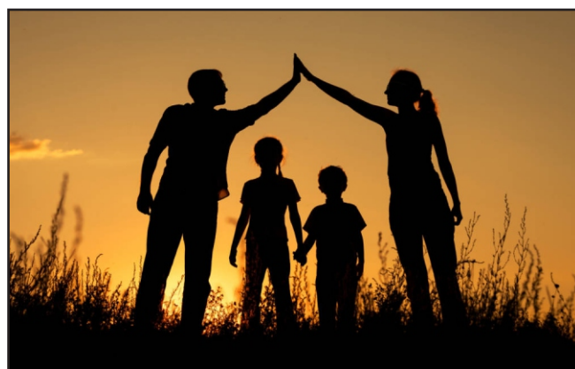
„Numai împreună bărbatul și femeia formează omul complet.” Immanuel Kant

www.alianta-familiiilor.ro office@alianta-familiiilor.ro