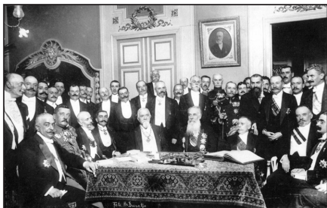
Consiliul Unirii. Chișinău - 1918