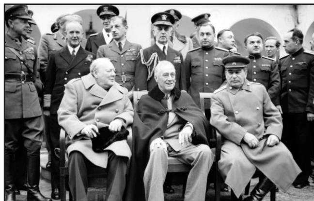
5 februarie 1945, Conferința de la Yalta: „geambașii” țărilor sud-est-europene – în prim plan, stg.-dr.: Wiston Churchill, Franklin Delano Roosevelt și Iosif Vissarionovici Stalin.