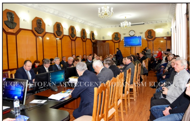
Chișinău, 24.01.2018, Academia de Științe a Moldovei: imagine dinspre prezidiu din timpul desfășurării lucrărilor Conferinței științifice: „Unirea Principatelor române și problema Basarabiei”.