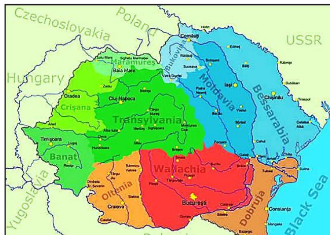
Provinciile istorice ale României Mari